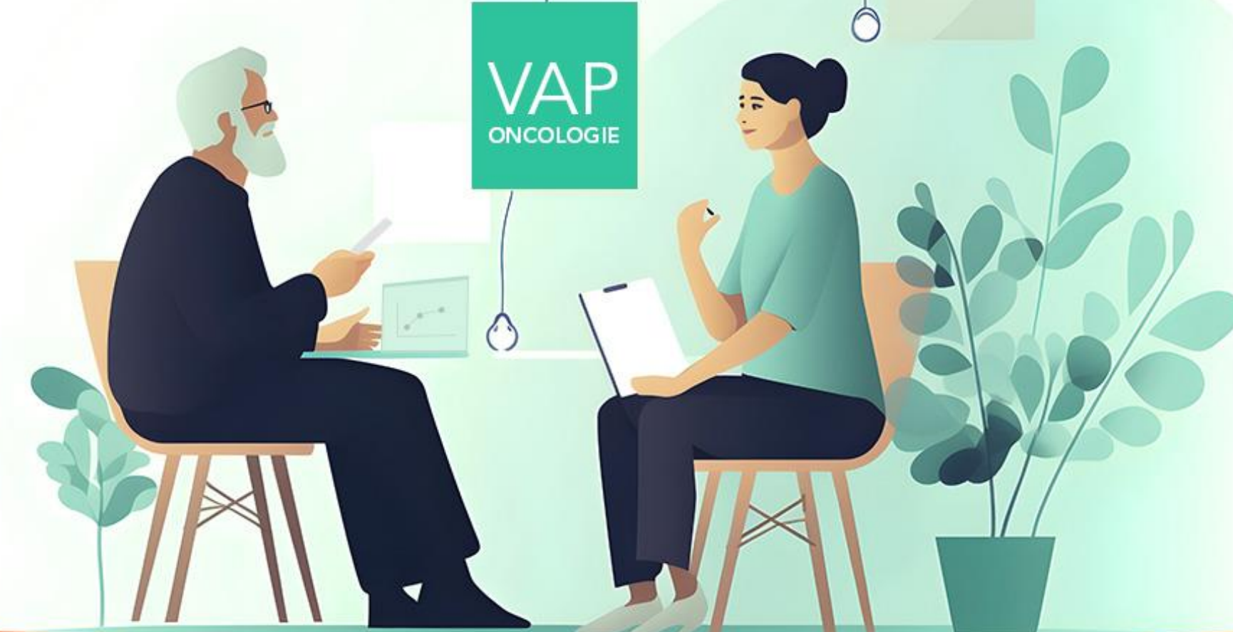
Vast Aanspreekpunt Oncologie buiten de muren van het ziekenhuis

'Een laagdrempelig aanspreekpunt waar je terecht kunt met eenvoudige vragen, twijfels en geruststelling. Dat had ik prettig gevonden'. 'Goede kankerzorg is meer dan een medische behandeling', Doneer Je Ervaring (DJE), NFK, 2018